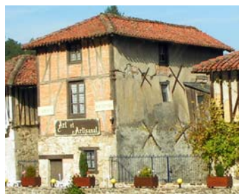
Maison avec tirans Saint-Léonard-de-Noblat

On fera également attention à supprimer les éventuelles infiltrations d'eau (voir l'état des toitures).